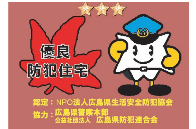
優良防犯住宅 認定シール

認定を受けた優良防犯住宅には、認定証及び認定シールを交付 ※認定シールについては、認定ランクにより異なる。